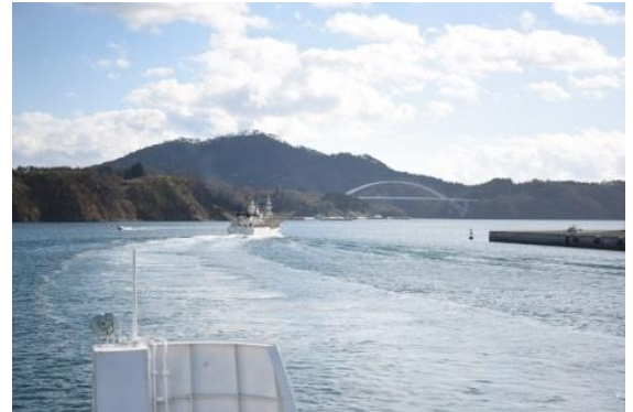
気仙沼湾から見る大島 橋は2019に開通予定です