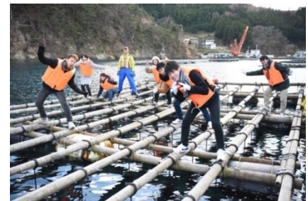
いかだの上で 海の水は冷たかったです