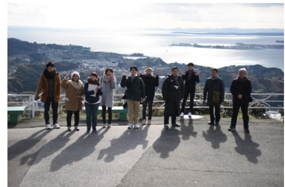
亀山山頂にて 金華山が綺麗に見えました