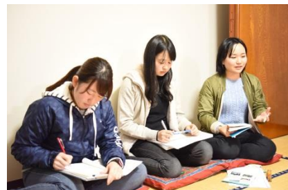
夜のミーティングでは、その日感じたことをみんなで話し合いました