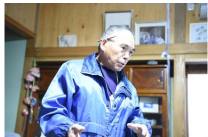
「ひまわり」の船長さんから津波を乗り越えた話を聞きました 震災後は、島と街との間の連絡船として活躍しました