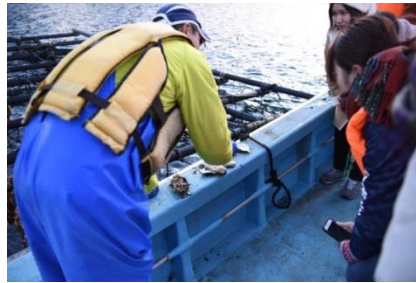
綺麗な海でカキがすくすくと育っていました